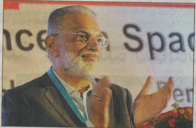
ಬೆಂಗಳೂರಿನಲ್ಲಿ ಬುಧವಾರ 4ನೇ ಬೆಂಗಳೂರು ಬಾಹ್ಯಾಕಾಶ ಎಕ್ಸ್‌ಪೋ ಉದ್ಘಾಟನಾ ಸಮಾರಂಭದಲ್ಲಿ ಇಸ್ರೊ ಅಧ್ಯಕ್ಷ ಡಾ. ಕೆ. ರಾಧಾಕೃಷ್ಣನ್ ಭಾಗವಹಿಸಿದ್ದರು.

ಉದ್ದಿಮೆಗಳು ಬೆಳೆಯುತ್ತಿದ್ದು, ಸಮಕಾಲೀನ ಅಗತ್ಯಗಳಿಗೆ ಇಲ್ಲಿ ನಡೆಯುತ್ತಿರುವ ಉಪಗ್ರಹ ಸಂಶೋಧನೆಗಳು ನೆರವಾಗುತ್ತಿವೆ. ಬಾಹ್ಯಾಕಾಶವನ್ನು ಶಾಂತಿಯುತ ಉದ್ದೇಶಗಳಿಗೆ ಬಳಕೆ ಮತ್ತು ಅಂತಾರಾಷ್ಟ್ರೀಯ ಸಹಕಾರ ಅಭಿವೃದ್ಧಿಯಲ್ಲಿ ಇಸ್ರೊ ಸಾಧನೆಗೆ ಇದೀಗ ಇಂದಿರಾ